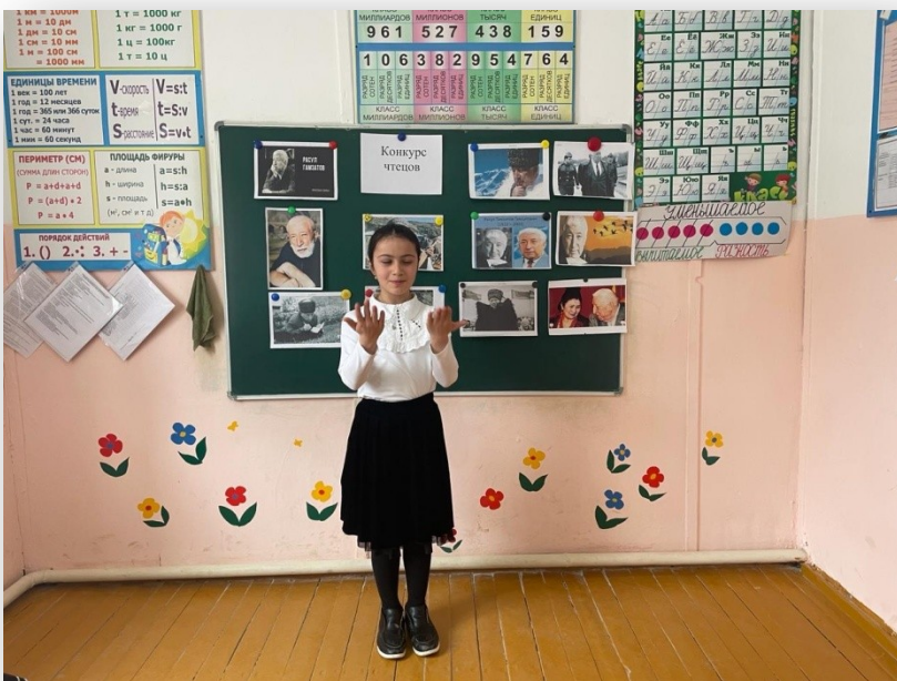
Конкурс чтецов по произведениям Р. Гамзатова