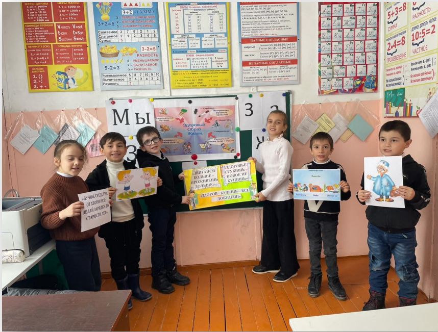
Внеклассное мероприятие «Мы за ЗОЖ»