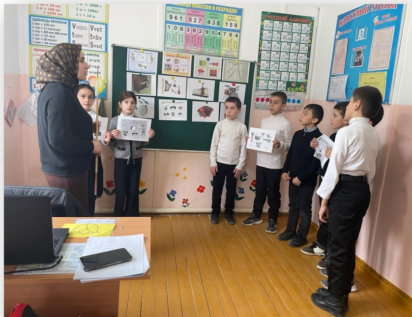
Классный час «Музыкальные инструменты»