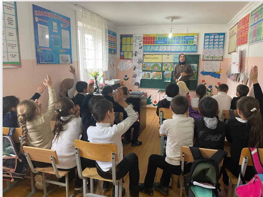
Викторина по сказкам 1-4 класс