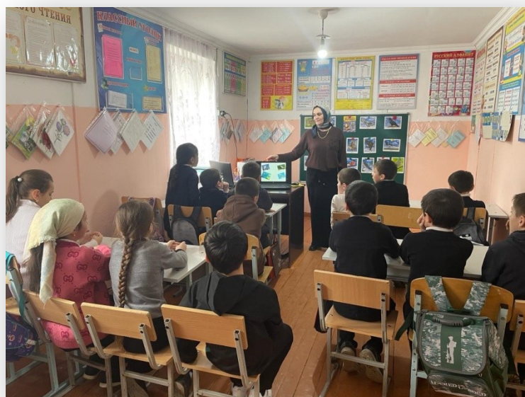
Внеклассное мероприятие «Птицы наши друзья» 1-4