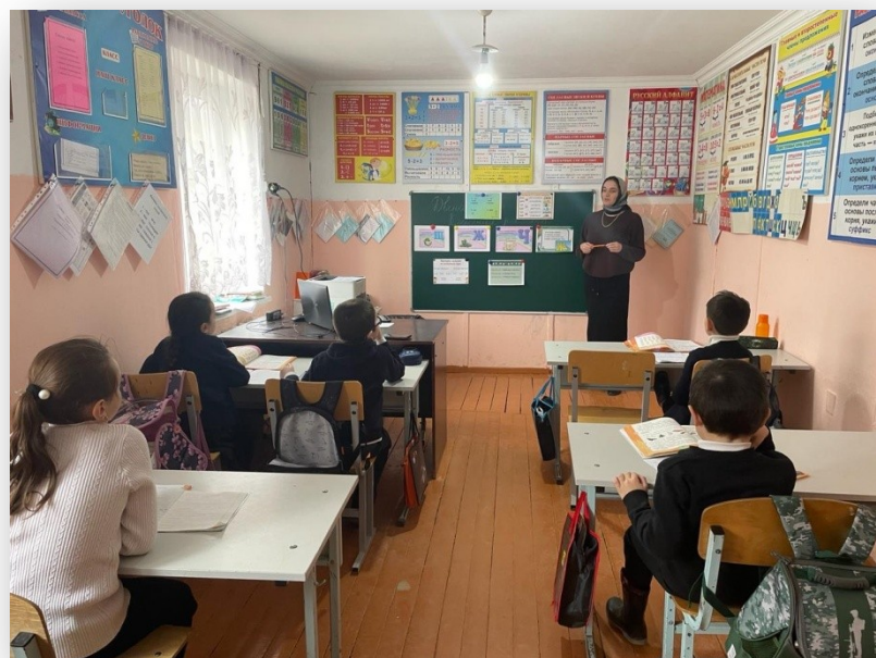
Открытый урок по русскому языку «Шипящие звуки и буквы» 1 класс