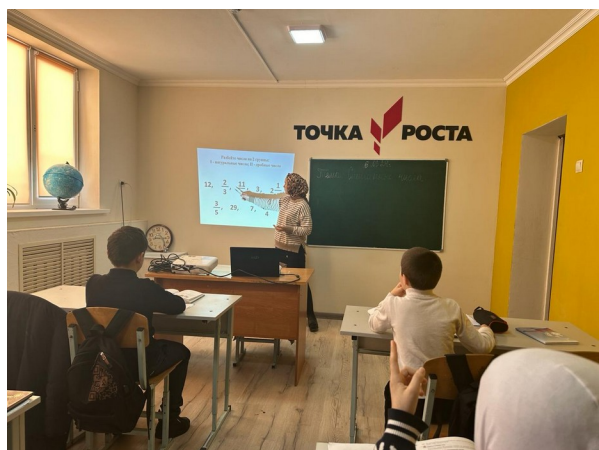
Открытый урок «Смешанные числа»