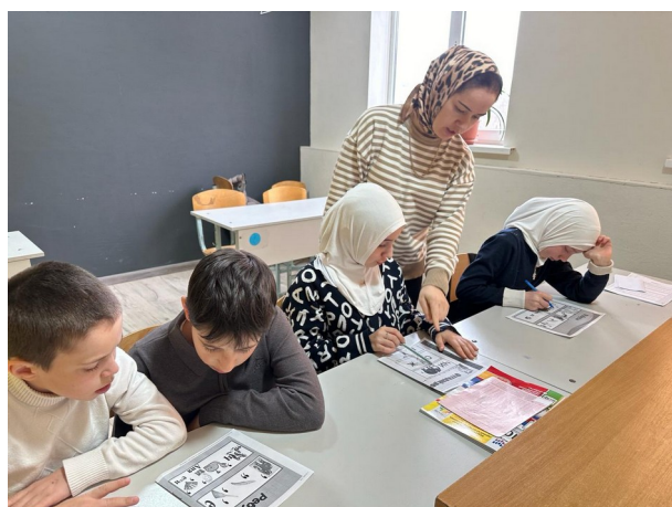
Математические ребусы, головоломки.