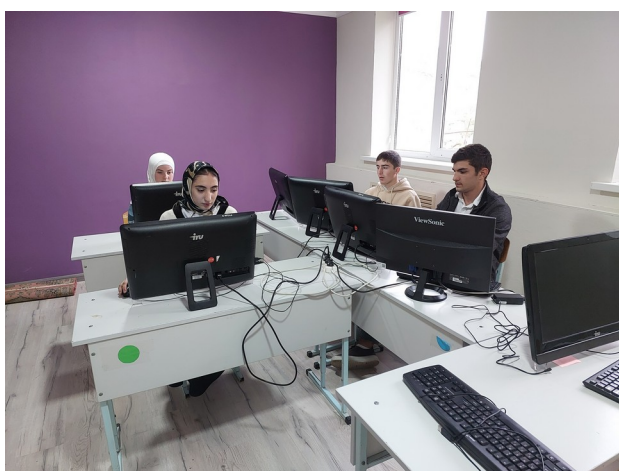
Путешествие по заданиям ЕГЭ