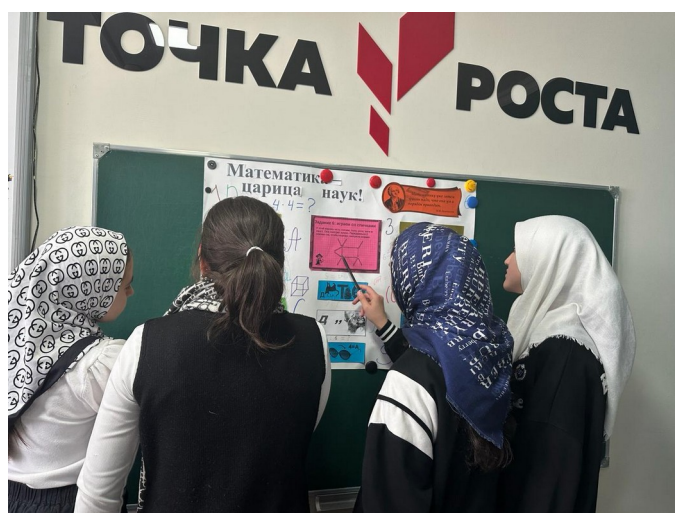
Решение головоломок и кроссвордов.