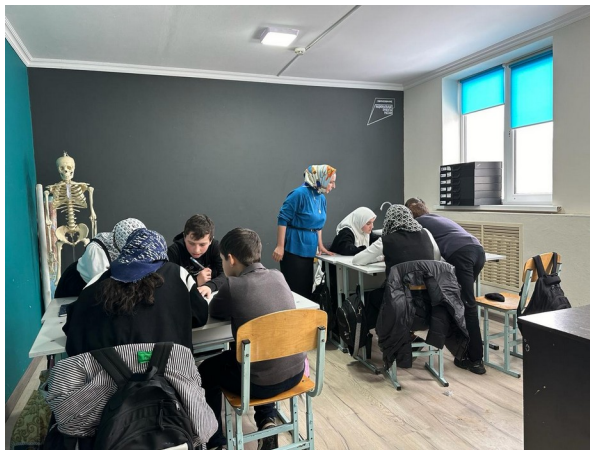
Математический турнир «Веселая математика»