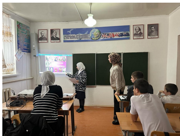
Презентация «Галерея Великих математиков»