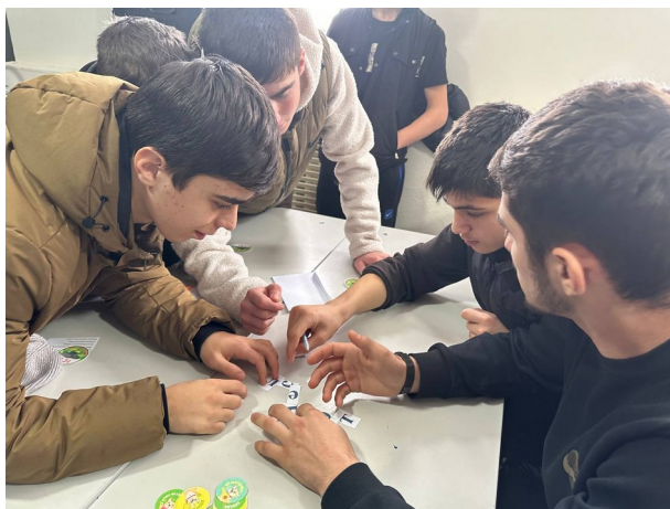
Интеллектуальная игра «Счастливый случай»