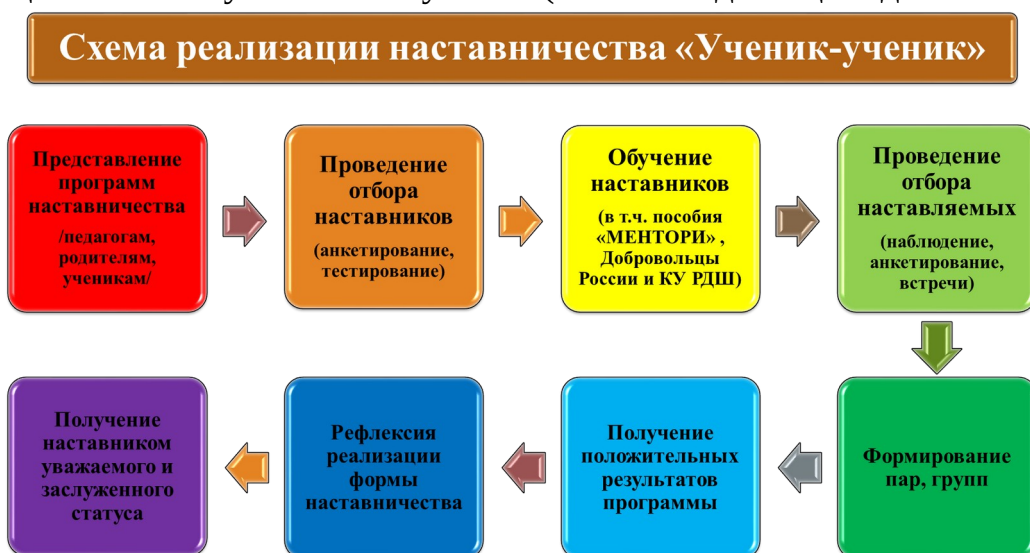
Рис.1. Описание схемы реализации наставничества «ученик-ученик»

Целью взаимодействия наставника и наставляемого является разносторонняя поддержка обучающегося с особыми образовательными/социальными потребностями либо временная помощь в адаптации к новым условиям обучения (включая адаптацию детей с ОВЗ).