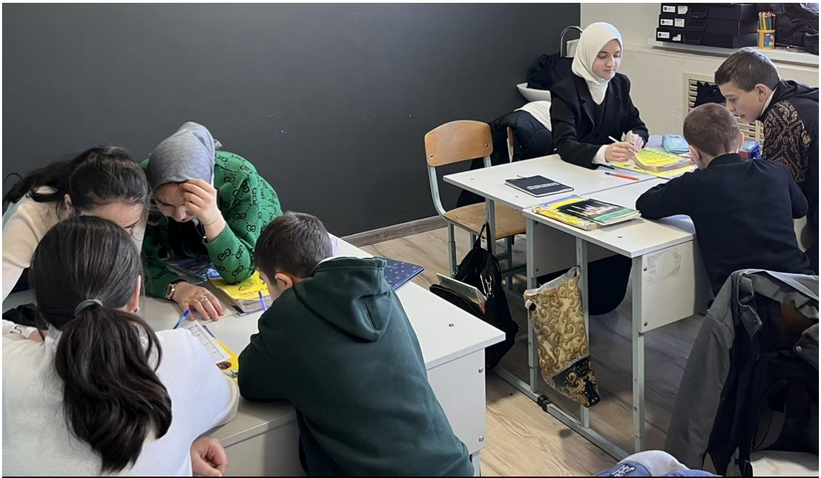
Брейн-ринг «Своя игра»