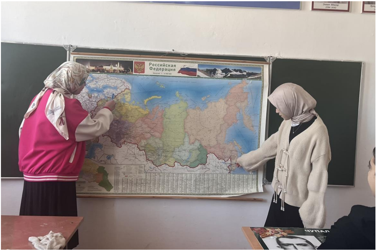
Игра на переменах «У карты мира»