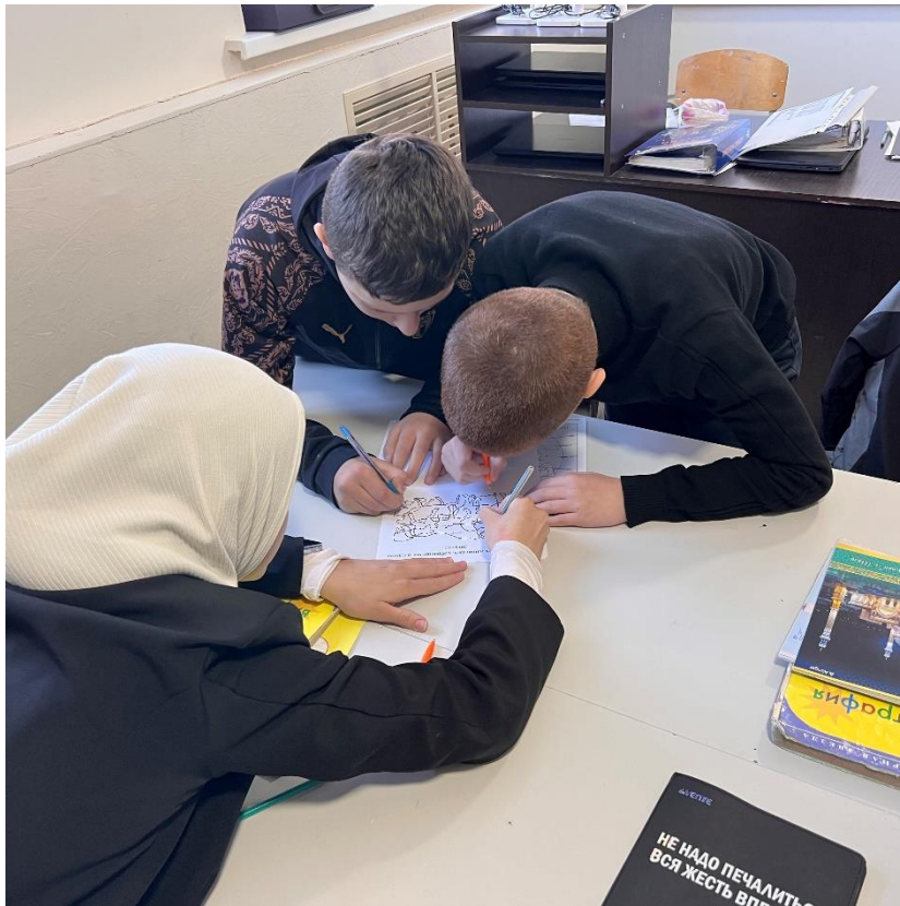
Игра «У карты мира»