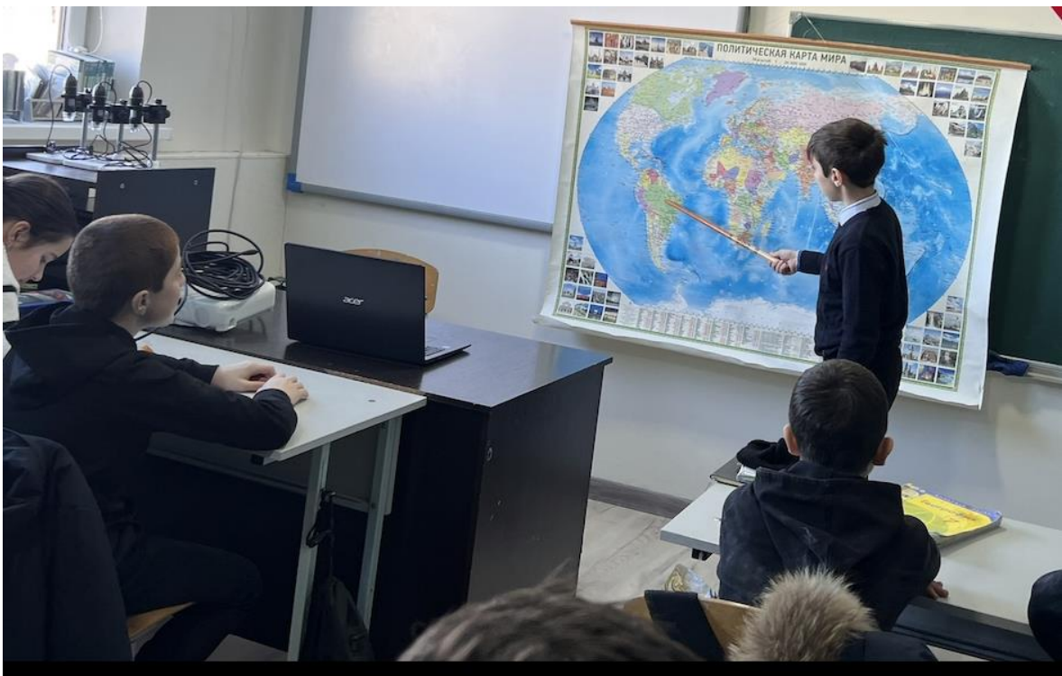
Игра «Заполни карту за 5 мин»