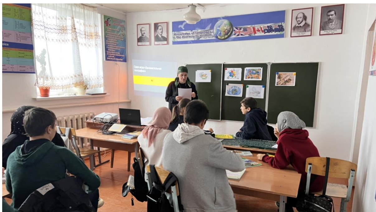
Викторина игра «Города России»