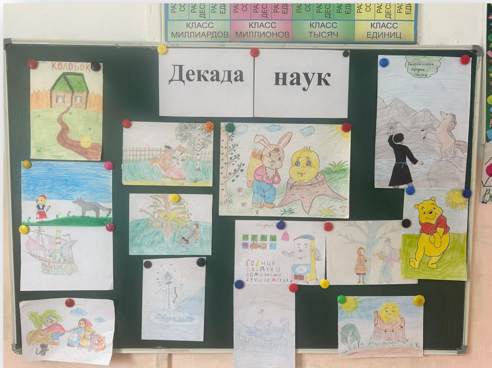
Конкурс «Лучшие рисунки»